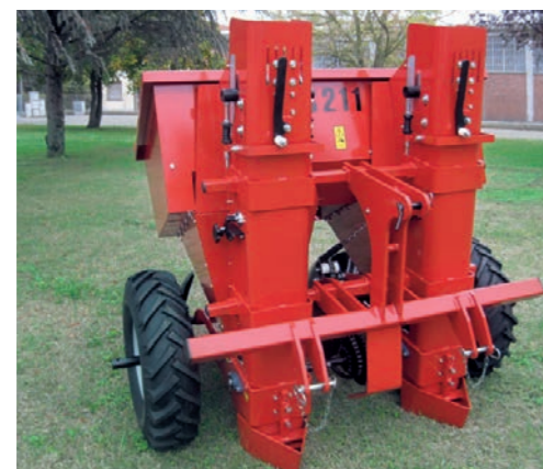
Vista frontale Front view Vue frontale

Dischi rinalzatori per richiudere il solco Ridger discs to close the groove Disques buteurs pour refermer le sillon