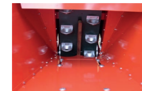
Canale di discesa seme Seed descent chute / Canal de descente de la semence