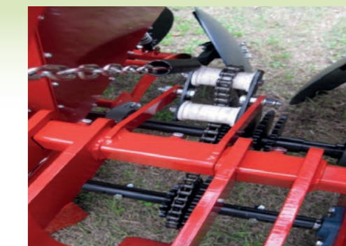
Trasmissione / Transmission / Transmission

CARLOTTI MACCHINE AGRICOLE Qualità Italiana da 50 anni