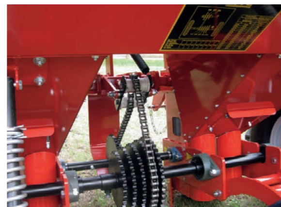
Trasmissione a catena collegata all'albero delle ruote Chain transmission connected to the wheel shaft Transmission à chaîne reliée à l'arbre des roues