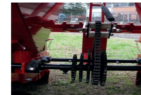
Trasmissione / Transmission / Transmission